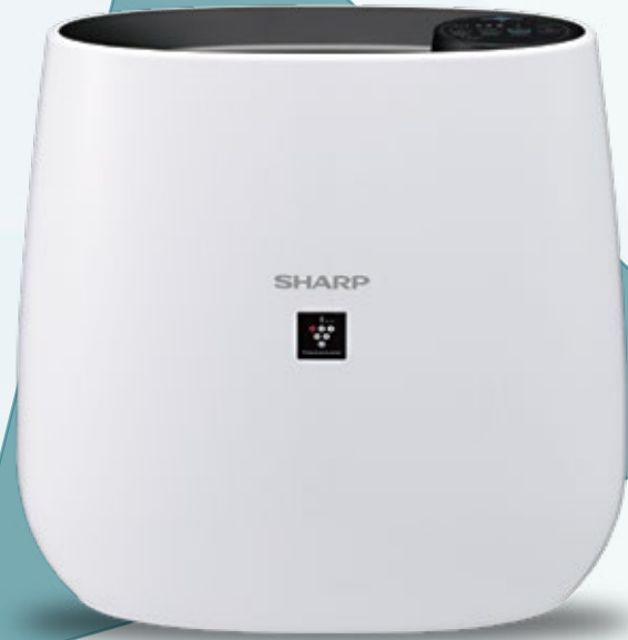
FP-JA30M / FP-J30M-B एयर प्यूरिफायर